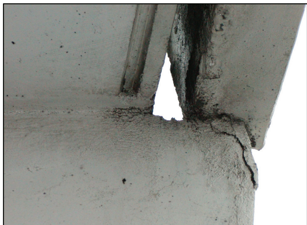
▲ Poruchy v uložení zábradlia na konzolu lodžiovej steny Faults in mounting of railing to the console of loggia wall

zvýšeným miestnym tlakom vznikajúcim prenosom deformácie lodžiových stien „blokovacím mechanizmom“ (najmä v najvyšších podlažiach) do obvodového plášťa.