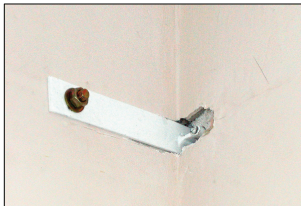
▲ Dodatočné prikotvenie lodží (zo strany bytu) Subsequent anchoring of loggias (from the apartment side)