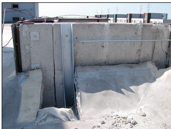
Zabezpečenie dilatácie atiky v nároží Provision for dilation of attics at the corner