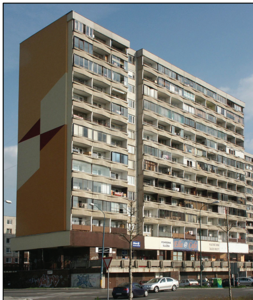
Pohľad na západné priečelie s predašenými lodžiami View of western front with protruding loggias

Bočné steny lodžií tvoria nosné železobetónové panely hrúbky 150 mm. Podľa typového projektu sú prikotvené k nosnej konštrukcii domu tak, aby umožňovali zvislé a vodorovné deformácie v smere rovnobežnom s priečelím vyvolané rozdielom teploty uvedených konštrukcií. Z celkového počtu 132 lodžií je zasklených 70, čo je 53 %. Konštrukcia a tvar zasklenia lodžií sú rôzne.