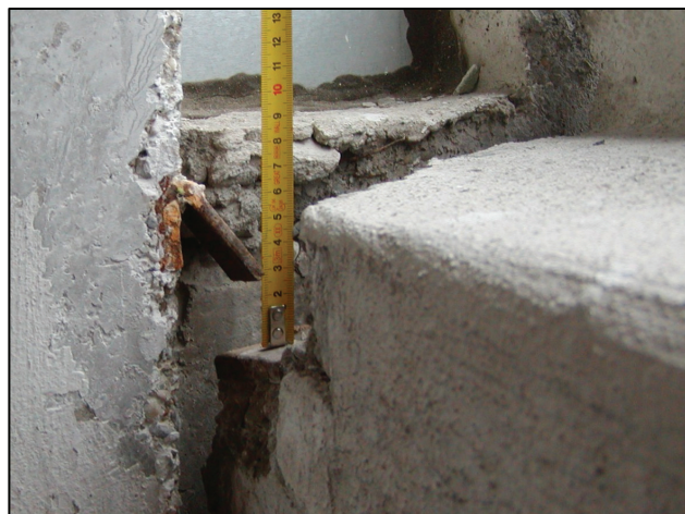
Nesprávne zhotovené horné kotvenie zábradlia Incorrectly made upper anchoring of railing

The side walls of the loggias are constructed of reinforced concrete panels with a thickness of 150 mm. According to the sample project they are anchored to the bearing structure of the building to allow for vertical and horizontal deformation in a direction parallel with the façade, which are caused by the temperature difference of the above-mentioned structures. Of the 132 loggias in total, 70 are glassed in, i.e. 53 %. The structure and form of the glazing of the loggias differ.