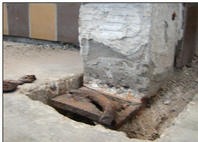
▲ Nesprávne zhotovené stredové kotvenie zábradlia k lodžiovej doske Incorrectly made central anchoring of railing to the loggia plate

emerging transfer of a deformation of loggia walls by the “blocking mechanism” (mainly on the highest floors) in the outer wall.