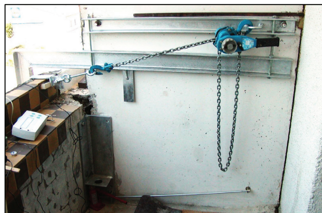
Upevnenie zábradlia s posunmi Fixing of railing with shifts