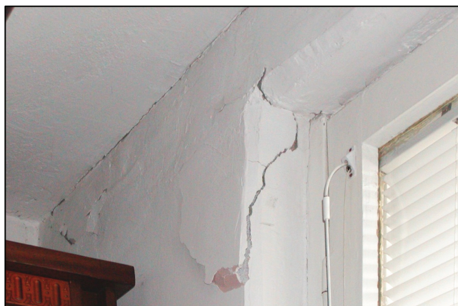
Poruchy v obvodovom plášti P1.15 v oblasti kotvenia K33 a K34 Faults in mounting of loggias to the console of loggia wall

Medzi lodžiou a bytovým domom (najmä v oblasti kotvenia K33 ) je „blokovací mechanizmus“, ktorý spôsobuje, že v kotvení K33 vytvára vzájomné silové pôsobenie značnej veľkosti. Hlavnými prvkami blokovacieho mechanizmu sú nesprávne zvary, zaliatie medzery medzi lodžiovými konštrukciami a obvodovým plášťom bytového domu a pevné uloženie kotvenia K33 . Existencia blokovacieho mechanizmu sa potvrdila celoročnými meraniami vzájomných posunov dom - lodžia. Rozhodujúce sú zvislé sily ktoré rastú s výškou vyšetrovaného miesta nad terénom a spôsobujú deformácie kotiev K33 . Keďže kotvenia K33 sú súčasne konzolami na uloženie spínaných pórobetonových obvodových panelov, uvedené deformácie negatívne ovplyvňujú stav napätosti v týchto paneloch. Prejavujú sa trhlinami až vypadávaním hmoty pórobetonu zo spínaných panelov obvodového plášťa.